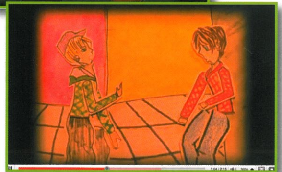
Extraits des dessins animés lauréats de l'an dernier.